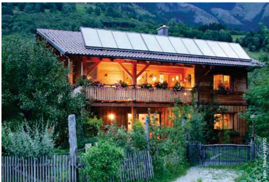
Holz100-Haus in Salzburg

Die Holz100-Wände, Pfosten und Decken werden schichtweise zu bis zu 36 Zentimeter starken Holzelementen aufgebaut. Notwendige Öffnungen werden nachträglich herausgefräst. Je nach Funktion, tragende oder nicht tragende Wände, Decken, Fußböden oder